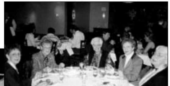
Il n'y avait pas que des femmes, mais ces deux tables étaient tellement bien garnies !