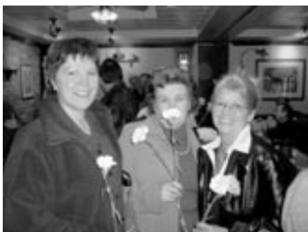
gravées dans notre mémoire!